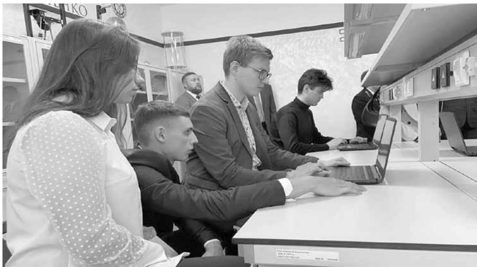
Для современной молодежи работа с нейросетями и затейливыми приложениями - дело привычное

Для современной молодежи работа с нейросетями и затейливыми приложениями - дело вполне привычное. И для этого даже не всегда требуется инженерное или программистское образование. Площадка конструкторского бюро оснащена техническими средствами с установленным на них современным программным обеспечением. Резиденты бюро могут пользоваться ресурсами Центра детского научного и инженерно-технического творчества при КузГТУ «УникУм», а в перспективе также и лаборатории инженерно-производственного центра инноваций «УникУм», на базе которого будет размещено промышленное и полупромышленное оборудование для работы над инновационными проектами.