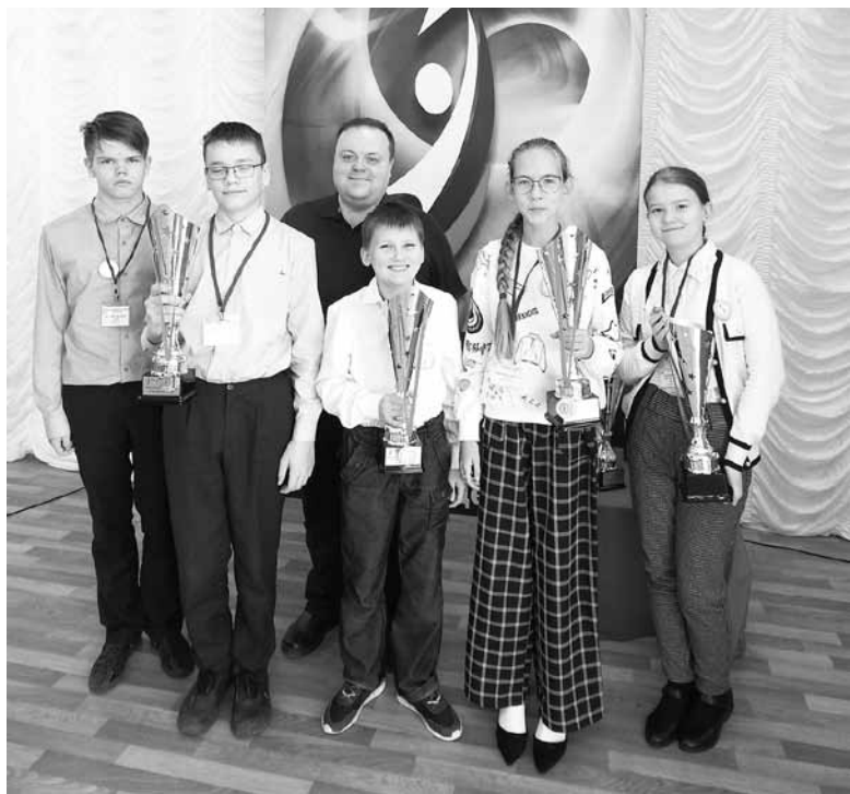
Команда из Тверской области