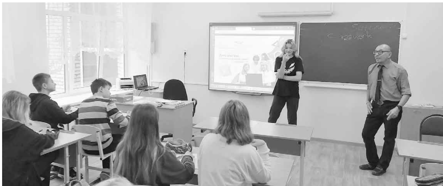
Во время ролевой игры на День учителя ребята поняли, как трудна профессия педагога

Светлана ПОТАПОВА, д. Пчева, Киришский район, Ленинградская область, фото автора