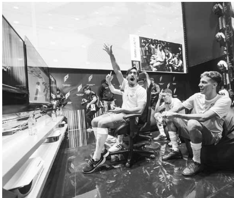
В следующем году планируется развитие фиджитал-центров

В Москве завершилось обучение для вузов по развитию фиджитал-спорта в России