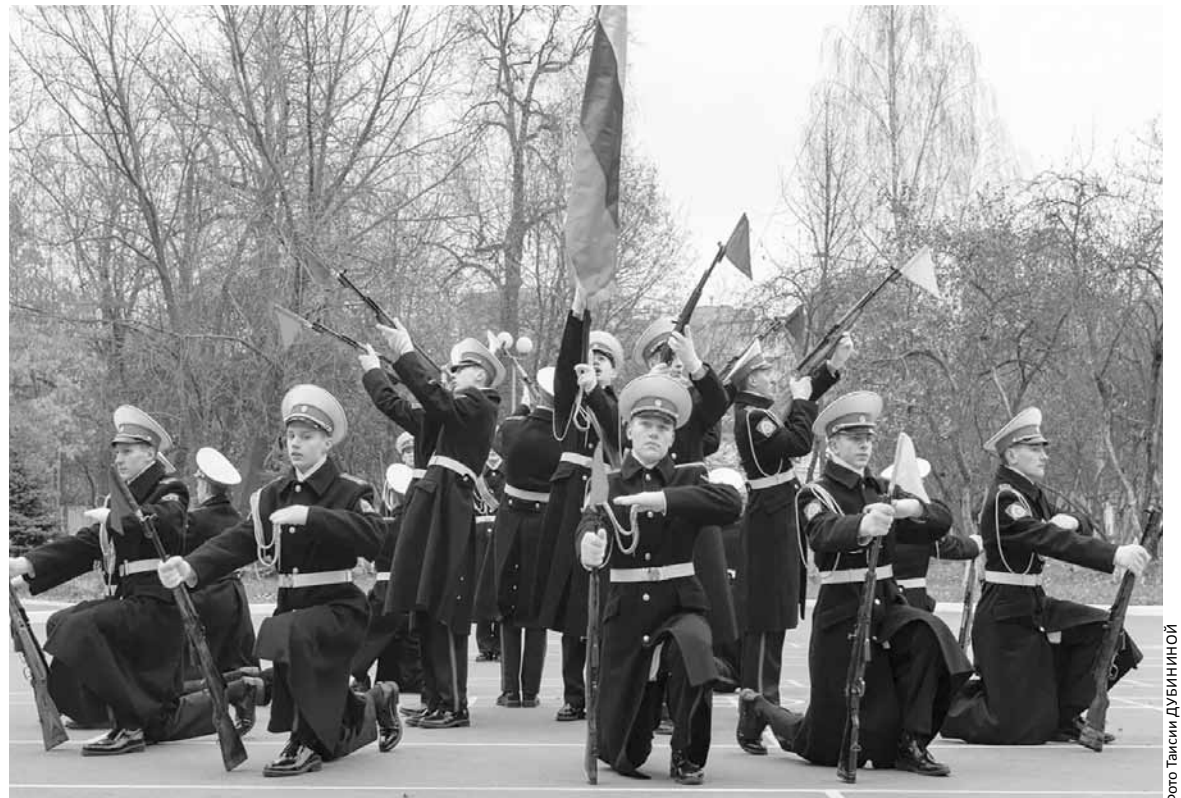
Кадет - это звучит гордо!

нят вопрос о заработной плате педагогов, она, увы, оставляет желать лучшего и гораздо большего. Не все отставные офицеры могут долго работать в кадетских корпусах, классах, потому что найти общий язык с подрастающим поколением не так просто, некоторые не выдерживают... Поэтому в кадетских учебных заве-