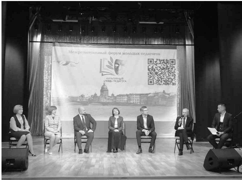
Внимание спикеров было обращено на профессиональные состязания

- В Год педагога и наставника абсолютно логично говорить о конкурсном движении, ведь педагогический конкурс - это прежде всего возможность личностного и профессионального роста, - отметил он. - Конкурс помогает посмотреть на себя со стороны, позволяет систематизировать опыт педагогической практики, увидеть сильные и слабые стороны в своей работе, создает условия для обмена опытом и в конечном итоге влияет на качество обучения. Я очень рад, что в 2023 году форум «Культурный код педагога» можно рассматривать как совместный проект Общероссийского профсоюза образования, Центра непрерывного повышения профессионального мастерства педагогических работников Санкт-Петербургской академии постдипломного педагогического образования, Информационно-методического центра Красносельского района Санкт-Петербурга, Межрегиональной организации Санкт-Петербурга и Ленинградской области Общероссийского профсоюза образования, Совета молодых педагогов Красносельского района и муниципального образования город Красное Село. Это пример творческого, плодотворного и эффективного сотрудничества.