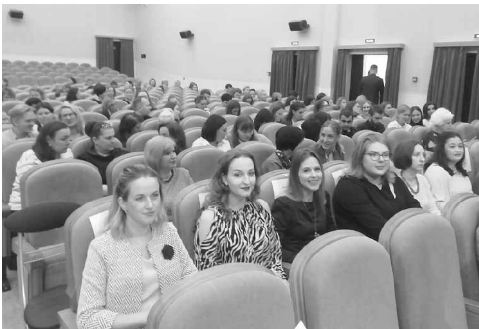
Новые приемы работы с аудиторией пригодятся при взаимодействии с классом

По окончании форума многие педагоги признались, что узнали о конкурсном движении такие интересные нюансы, о которых никогда не слышали, а также открыли для себя новые приемы работы с аудиторией, что, несомненно, пригодится при работе с классом.