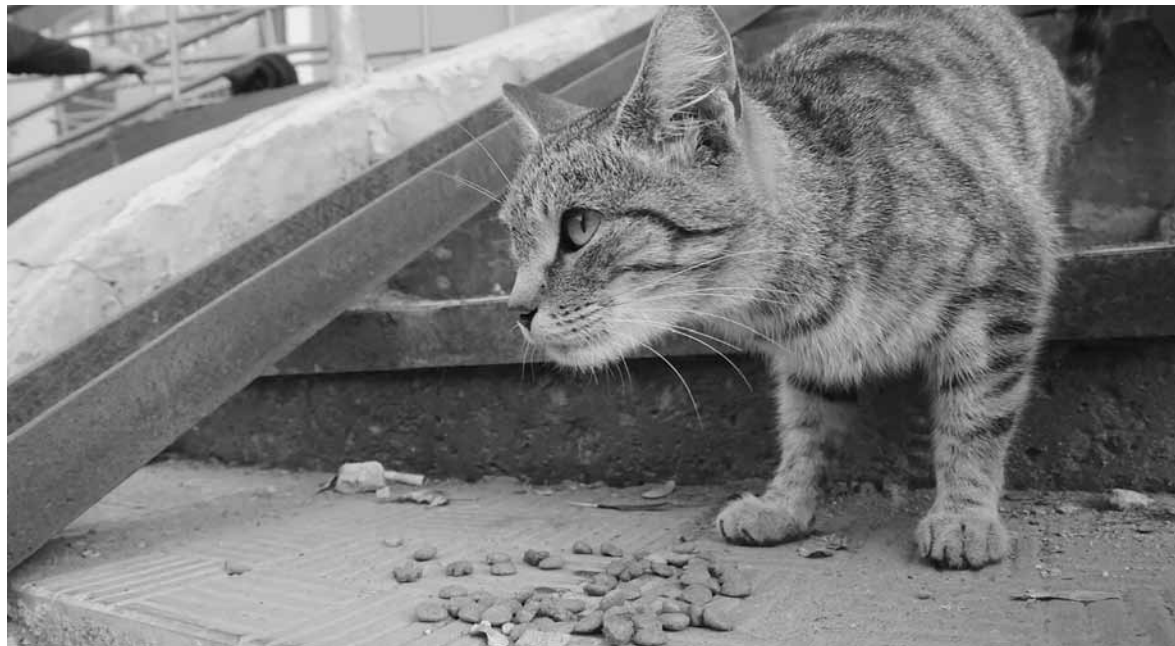
Надо было их не выгонять, надо будет о них подумать, но что с ними делать прямо сейчас?

Вспоминаю телешоу, где речь шла о том, что делать с бродячими собаками, которые ведут себя очень агрессивно и нападают на прохожих. Разбирали конкретный случай. Стая собак атаковала школьницу, повали-