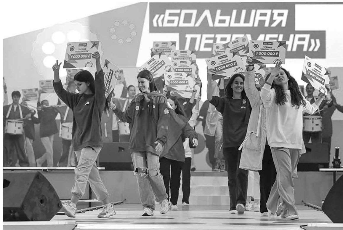
Участников и гостей мероприятия ожидала яркая программа

«И, конечно, хочу искренне поблагодарить ваших родителей, педагогов и наставников - всех, кто разделяет ваши интересы, помогает вам идти вперед, стойко выдерживать трудности, добиваться намеченных целей», - сказано в приветствии.