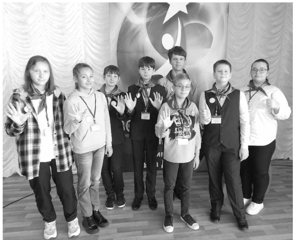
Команда лицей №4