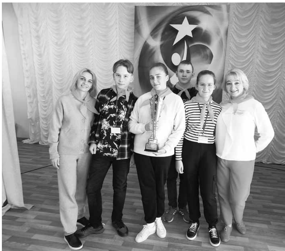
Команда из города Тулы, центр образования №8