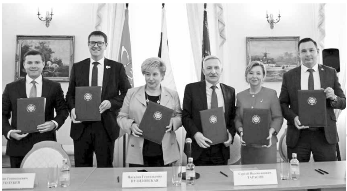
Создание УПО позволит централизованно выстраивать взаимодействие с коллегами из регионов