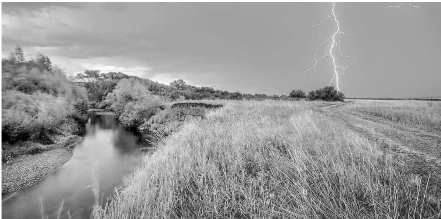
Фантазмагория цветов на закате во время грозы совершенно особенная