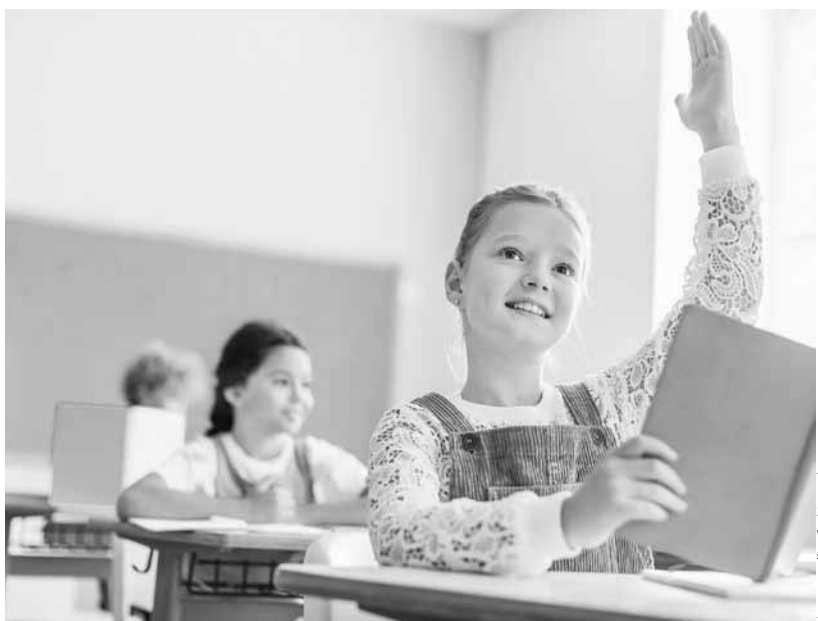
Школьники не всегда понимают мотивы собственных поступков

Прошли годы, и вдруг на улице буквально мне на шею бросается красивая взрослая девушка, радостно кричит: «Спасибо вам, вы нас всех так замечательно научили, я только что сдала отлично госэкзамен в университете,