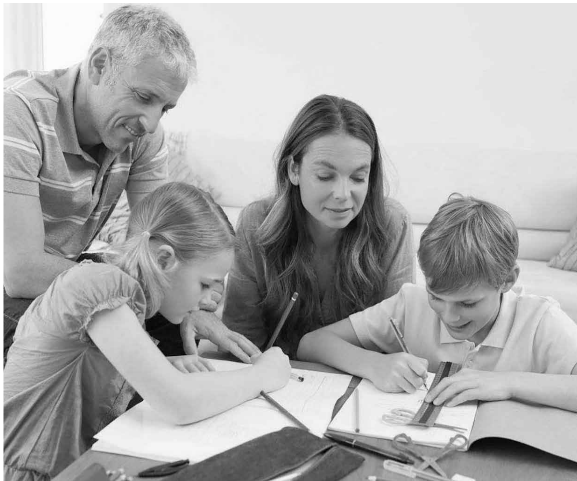
Родители - это первые педагоги жизни