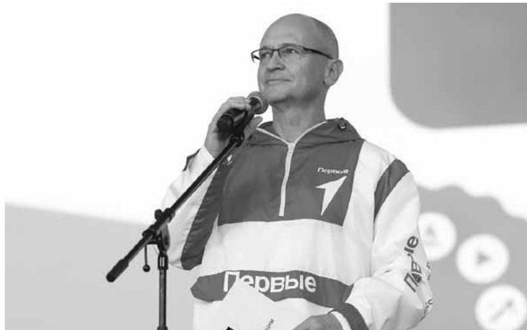
Первый заместитель руководителя Администрации Президента РФ Сергей КИРИЕНКО зачитал приветствие Президента России Владимира Путина финалистам «Большой перемены»

В этом году впервые наставники конкурса отправились в путешествие по России на поезде - «Педагогический экспресс» прошел по южным регионам России. Наставники победителей этого года также смогут отправиться в уникальные путешествия: по регионам Кавказа на «Педагогическом экспрессе» (для 150 педагогов - наставников победителей «Большой перемены»), на теплоходе по Волге в «Педагогическом круизе» (для 200 наставников победителей) или поехать в авторский образовательный тур от программы «Больше, чем путешествие».