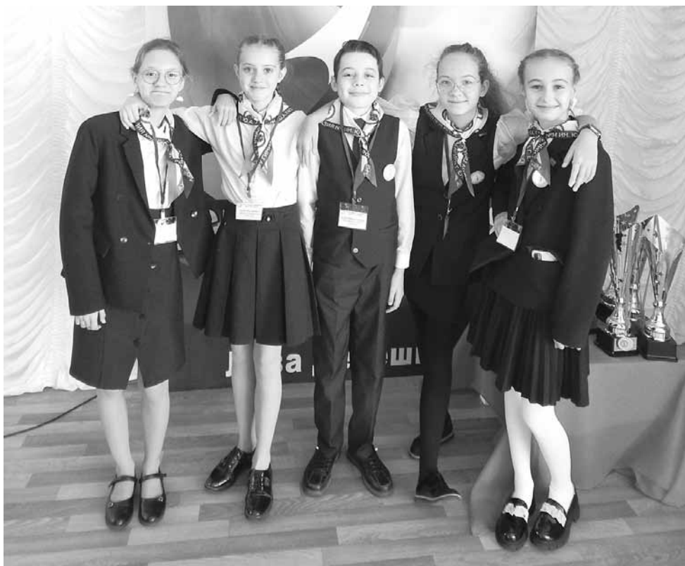
Команда гимназии №14