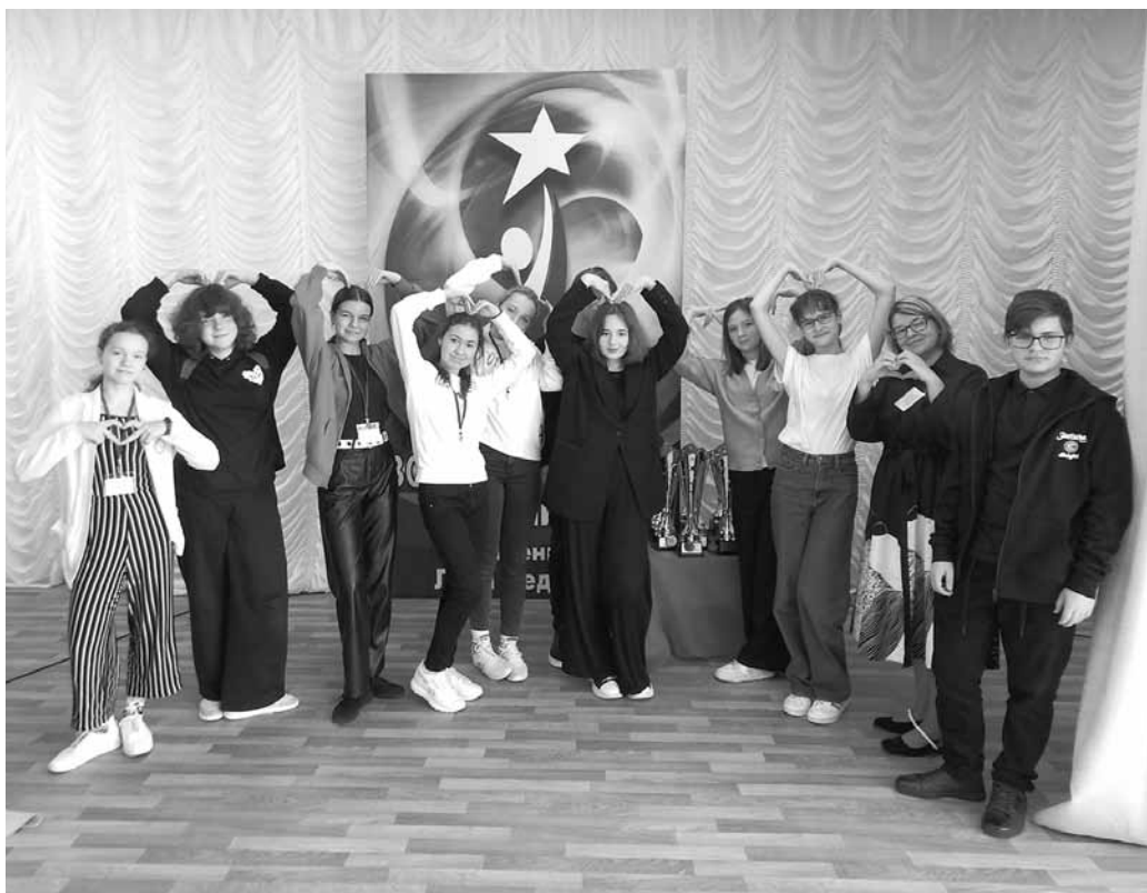
Команда из города Коломны, Московская область