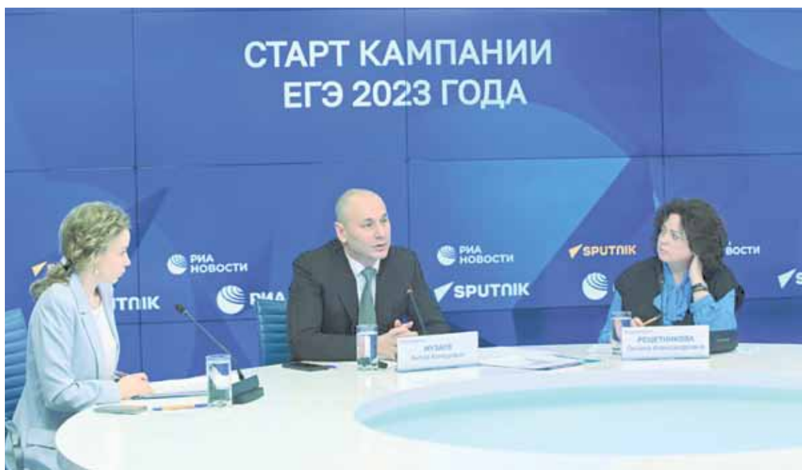
Анзор МУЗАЕВ на пресс-конференции рассказал об организации ЕГЭ в 2023 году

грамме, на которую они поступили. Также не подлежат пересмотру дипломы о высшем образовании граждан, которые уже прошли обучение по действующим в настоящее время уровням образования.