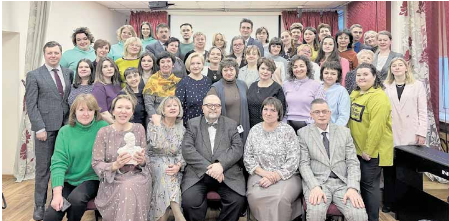
Участники и гости фестиваля: «Друзья, прекрасен наш союз!»

Да, именно в память об Александре Сергеевиче Пушкине 4 февраля вот уже шестой раз собрались учителя со всей страны на Педагогическую палитру «Пушкинский урок»-2023, которая проводится по инициативе Российского государственного педагогического университета имени А.И.Герцена при поддержке информационно-методических центров Красногвардейского и Центрального районов Санкт-Петербурга на базе