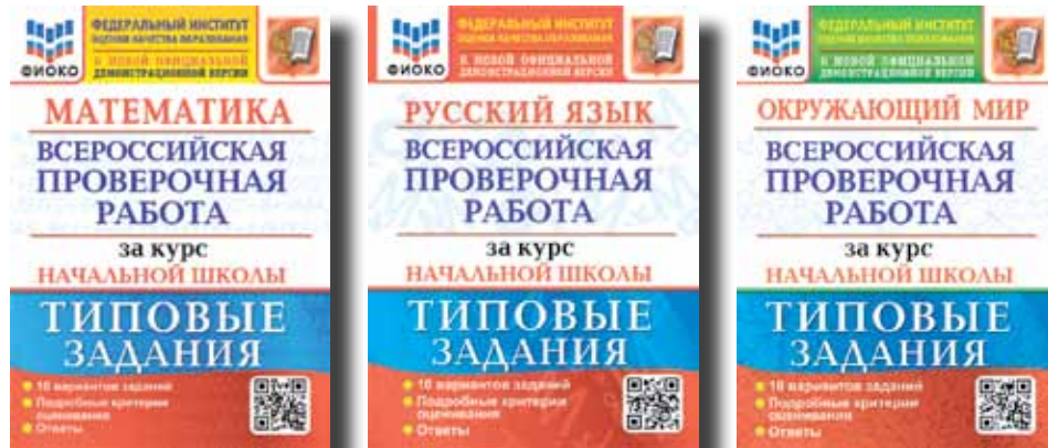
Издания для подготовки к ВПР, содержащие 10 вариантов и получившие положительную экспертную оценку ФГБНУ «ФИОКО»

Такие задания помогают отточить навык работы по алгоритму, заставляют создавать логические цепочки для решения поставленных задач.