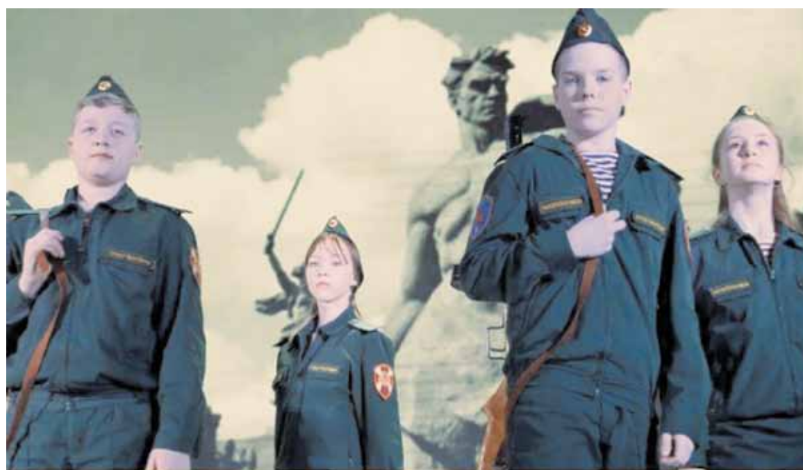
Попасть в гвардейские классы мечтают многие магаданские школьники

стве подобных контрольных событий можно выделить официальные олимпиады разного уровня, научные конференции, форумы, спортивные состязания, интеллектуальные состязания, творческие конкурсы. Возможно формирование иных направлений рейтинговой оценки, таких как волонтерство, военно-прикладные виды спорта и др. За участие и победу начисляется кратно разное количество баллов.