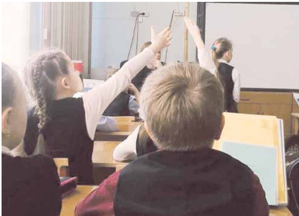
Личность обучаемого представляет собой неделимое целое