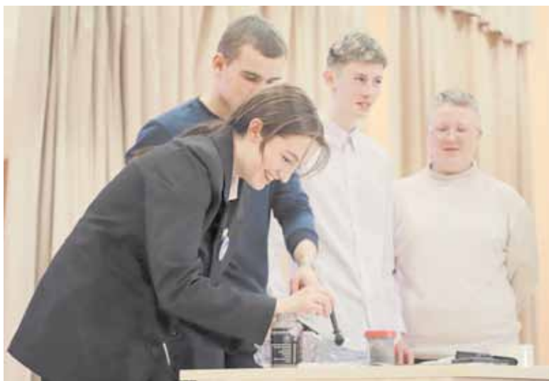
Региональный образовательный центр «Перспектива» регулярно проводит профильные смены для школьников по углубленному изучению предметов

Так, региональный образовательный центр Магаданской области «Перспектива», учрежденный Министерством образования Магаданской области в 2021 году, имеет четыре основных направления деятельности: «Наука», «Спорт», «Искусство» и «Военно-патриотическое воспитание». Кроме того, центр планирует активную работу с педагогическим сообще-