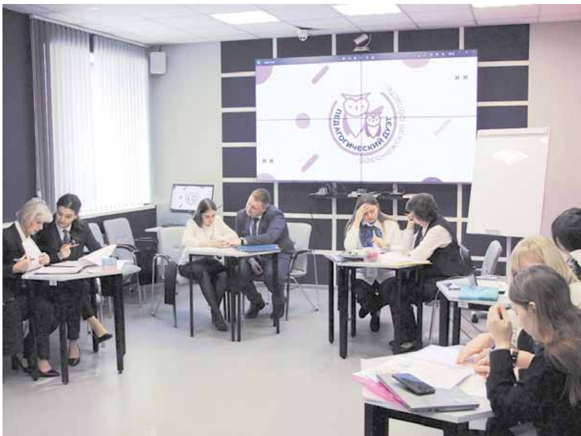
Тихо! Идет подготовка к выступлениям

- Моя помощь заключается в том, чтобы не подавлять, а дать возможность раскрыться молодому педагогу. У нас есть своя система, когда мы вместе планируем работу, вместе распределяем задачи между собой. И если молодому педагогу требуется помощь, я ее оказываю. А если справляется самостоятельно, я наблюдаю и сопровождаю. То есть следует не помогать постоянно, а давать возможность пробовать. Также мы проигрываем все моменты до того, как молодой педагог попадает к де-