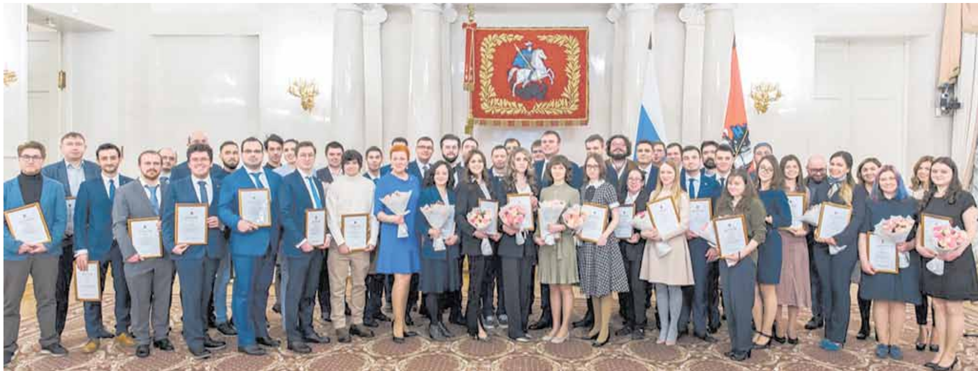
Лауреаты премии Правительства Москвы молодым ученым

В 2022 году в московских школах состоялось 130 лекций представителей научного сообщества - от молодых ученых до профессоров Российской академии наук. Их посетили более двух тысяч учащихся. Ученые рассказали школьникам о новых разработках и передовых технологиях, а также помогли сделать осознанный выбор образовательной траектории в сфере науки. С начала реализации проекта «Субботы московского школьника» в нем приняли участие свыше 1,4 миллиона человек. Участники проекта посещают ведущие научные организации, совместно с учеными и представителями вузов проводят практикумы и лабораторные эксперименты, обсуждают наиболее актуальные достижения и вопросы развития современной науки. Научно-популярный журнал «НАУ. Путеводитель по науке в Москве», издаваемый раз в два месяца, помогает сориентироваться в многомерном пространстве московского образования и науки, а также из первых рук получить информацию о важных открытиях и пути к ним. В рамках проекта также выходят курсы видеолекций, на которых ученые и популяризаторы научного знания рассказывают о своих исследованиях и разработках.