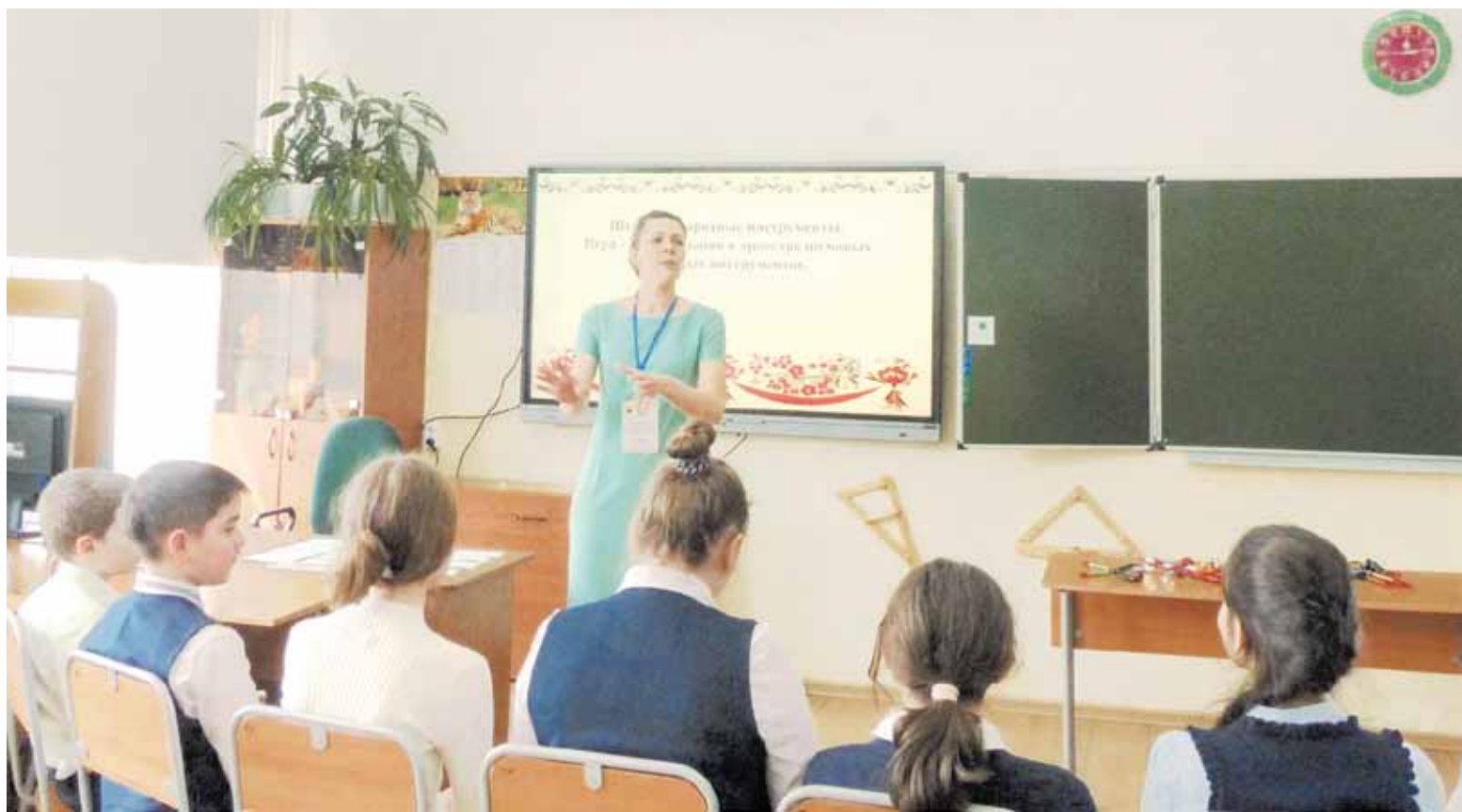
Ученики нисколько не сомневались в своем любимом педагоге

- Теперь я понимаю, как много значат участие в конкурсах, выход за привычные рамки, общение с коллегами, которым тоже много надо, кто стремится к совершенству в профессии. Я уже поучаствовала с тех пор во Всероссийской олимпиаде по русско-