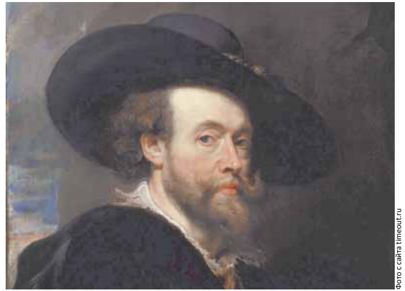
Питер Пауль РУБЕНС переосмыслил отношения живописи и дипломатии

Конечно, нельзя обойти вниманием и раздел «Миф о Вавилонской башне». Сколько ее метафорических воплощений видели в изобразительном искусстве, архитектуре, чертежах! Некоторые из этих воплощений